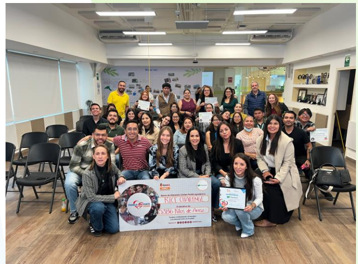
Rice challenge Banco de Alimentos Puebla 22,072 beneficiari@s