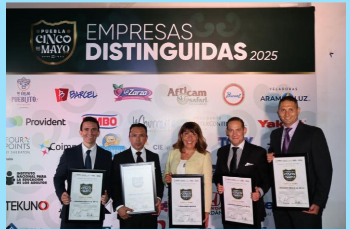
Obtuvimos el Reconocimiento al Trabajo Digno Secretaría del Trabajo del Gobierno del Estado de Puebla