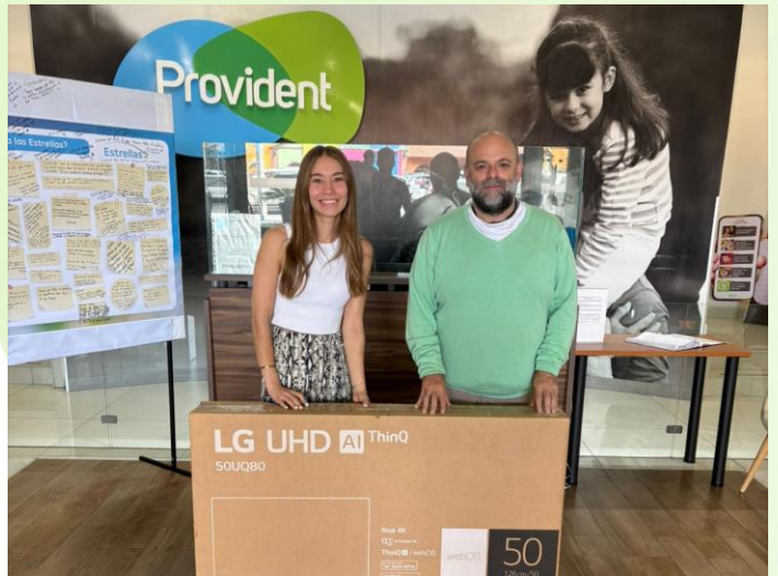
Donación para centro comunitario DIF Municipal Puebla 105 beneficiari@s