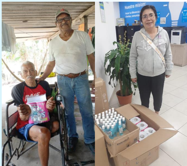
Donación de kits de salud Varias asociaciones 1,056 personas beneficiadas