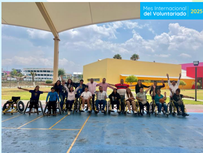
Convivencia con niñ@s con discapacidad Fundación Teletón Pachuca, Hidalgo 400 beneficiari@s