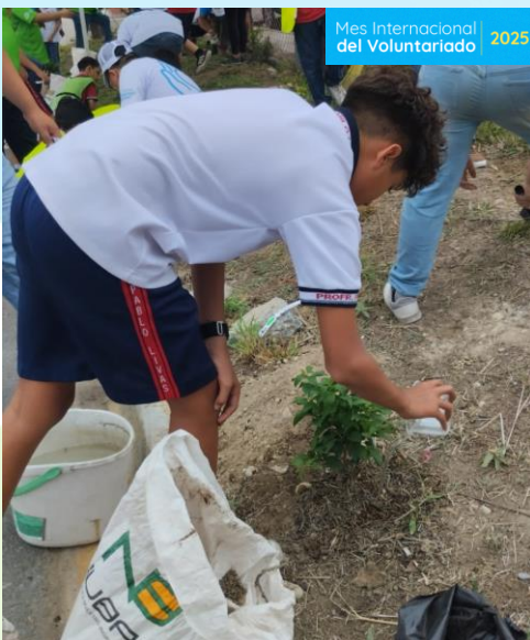
Reforestación escolar Somos más decididos Mty, NL. 200 beneficiari@s