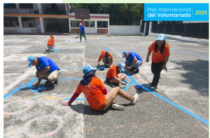
Rehabilitación escolar PROED CDMX 70 beneficiari@s