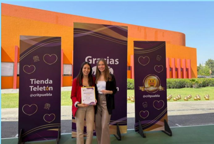
Reconocimiento "El Puerquito de Oro" Fundación Teletón- CRIT Puebla