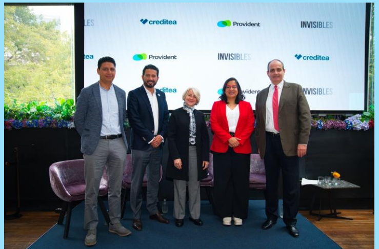
Estudio Invisibles Creditea, IPF, Provident Visibilizar los retos de la inclusión financiera en nuestro país