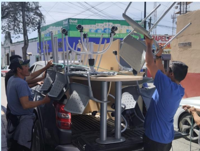
Donación de mobiliario Varias asociaciones Nacional 601 beneficiari@s