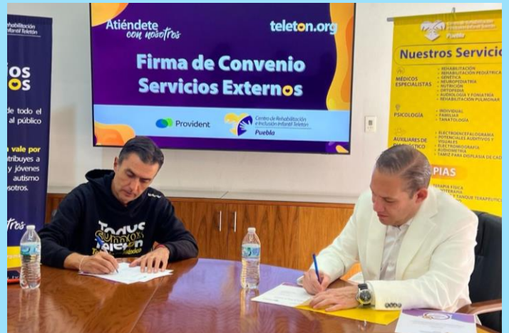
Acuerdo colaboración Fundación Teletón Servicios externos para colaboradores y familiares Provident