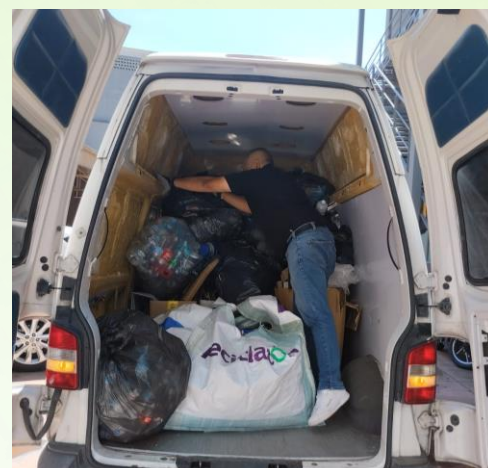
Reciclación Teletón Puebla