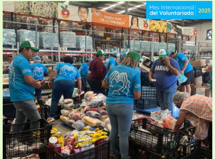
Armado de despensas Banco de Alimentos Mérida, Yucatán 30,914 beneficiari@s