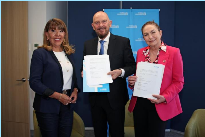
Acuerdo colaboración ONU Mujeres Programa Finanzas para todas: inclusión financiera para mujeres emprendedoras