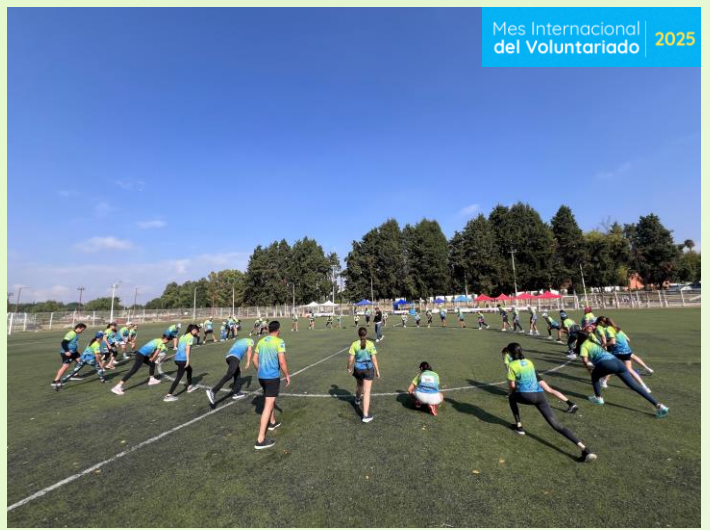
Provident RUN UNICEF Nacional 65 beneficiari@s