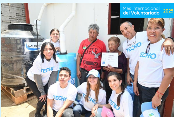
Instalación de 3 SCALL's Techo Puebla 15 beneficiari@s