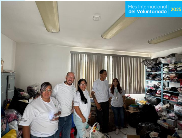
Apoyo a mujeres embarazadas VIFAC Aguascalientes 45 beneficiari@s