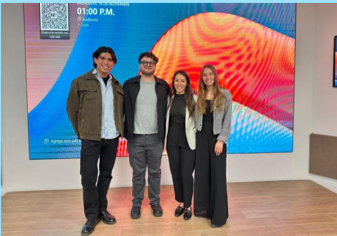
Plática Liderazgo consciente: la revaloración de la masculinidad en el mundo moderno Lentes Púrpura