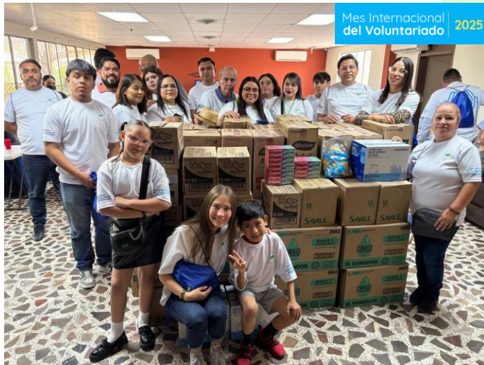
Convivencia con Adultos mayores Cadenas de Ayuda Mexicali, BC 50 beneficiari@s