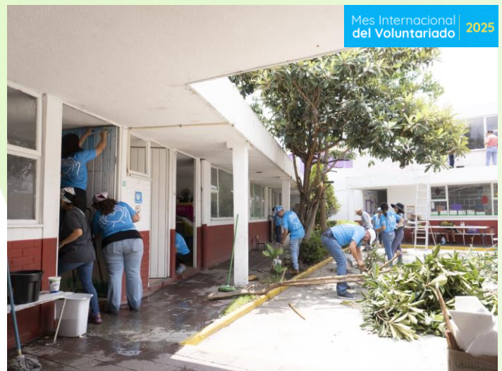
Rehabilitación de centro comunitario Colectivo Tomate Puebla 100 beneficiari@s