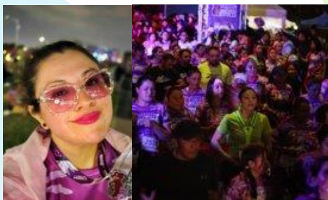
Carrera de la Mujer Gobierno de Puebla Conmemoramos el Día Internacional de la Mujer