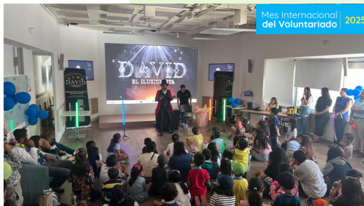
Día del Niño Corporativo 111 niñ@s beneficiad@s