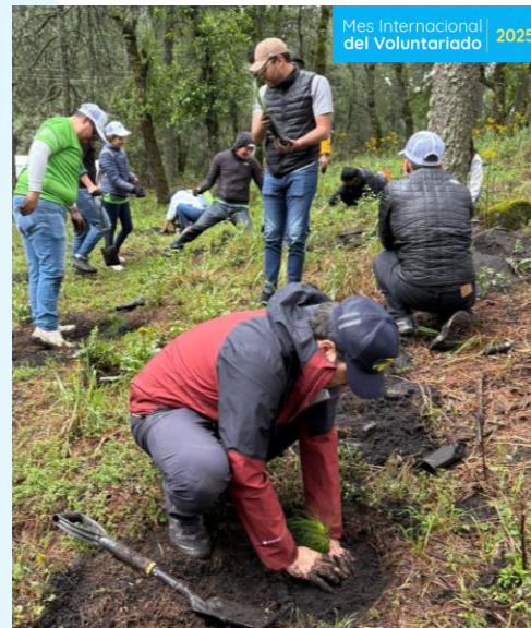
Reforestación Reforestamos México Puebla 1 ha adoptada - 700 arboles

Seguimos invirtiendo en la instalación de paneles solares en nuestras sucursales, con lo que estamos generando ahorros ente el 10% y el 44%.