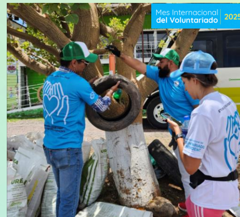
Mural y limpieza de cuerpo de agua ECOPIIL Querétaro 1,680 beneficiari@s