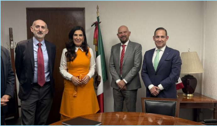
Reunión con Diputada Kenia López Rabadán Cámara de Diputados Compartimos nuestra visión y compromiso con el empoderamiento femenino