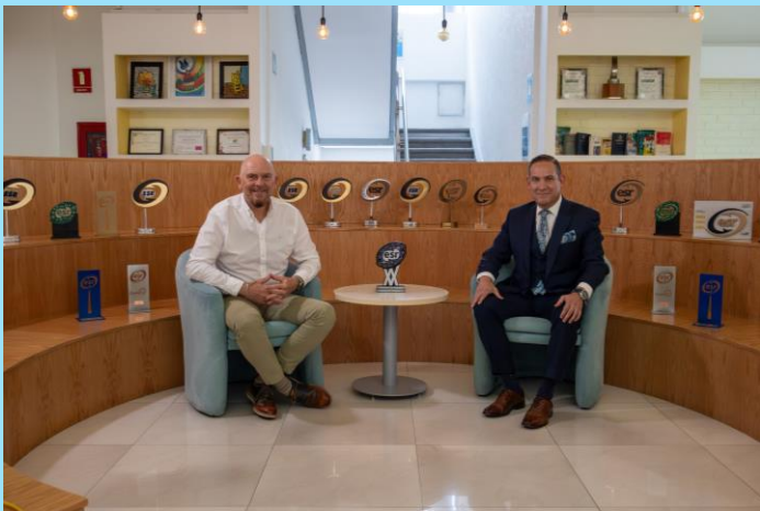
Obtuvimos por 20 años consecutivos el Distintivo Empresa Socialmente Responsable por CEMEFI