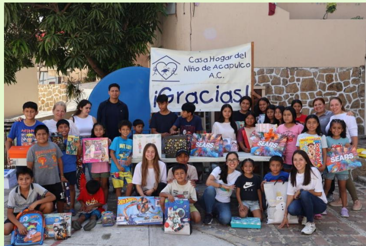
Operación Juguete DIF Acapulco, Casa Hogar del Niño de Acapulco AC 90 niñ@s beneficiad@s

Nos centramos en los problemas que son importantes para nuestras partes interesadas, en 2025 invertimos más de 1 millón de pesos en programas comunitarios a través de alianzas que benefician diferentes causas. Conoce las actividades que llevamos a cabo.