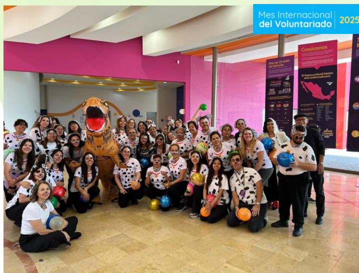
Día del Niño Teletón CRIT Puebla 650 personas beneficiadas