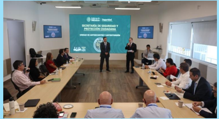
Plática de prevención del delito Secretaría de Seguridad y Protección Ciudadana