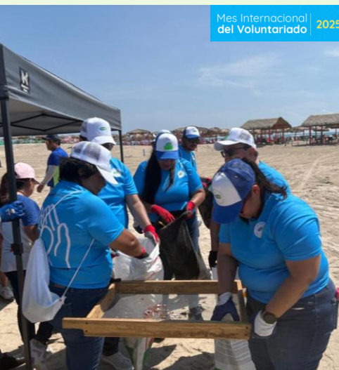
Limpieza de playa Somos más decididos Tampico, Tam. 300 m3 de playa 41.96 kgs de residuos