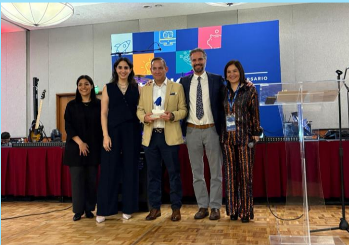
Reconocimiento por alianza estratégica EDUCA México Programas de educación financiera